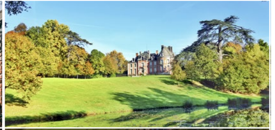
Les Parc et jardin de Chantore 50530 Bacilly (FR)