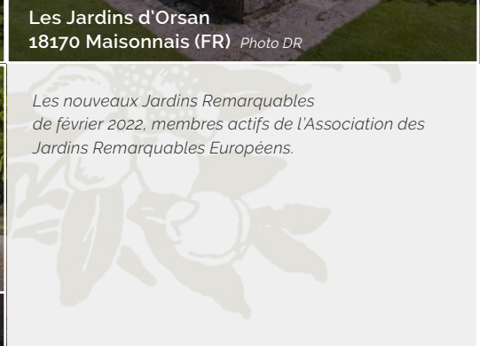
Les nouveaux Jardins Remarquables de février 2022, membres actifs de l'Association des Jardins Remarquables Européens.