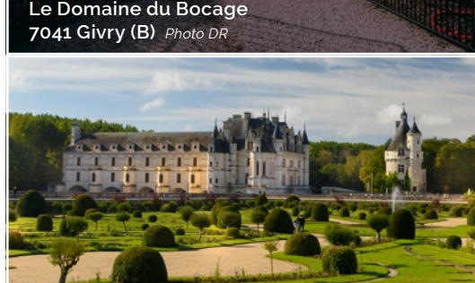
Le Château de Chenonceau 37150 Chenonceau (FR)