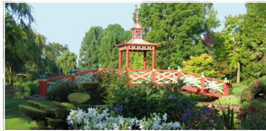
Le Domaine d'Apremont 18150 Apremont-sur-Allier (FR)