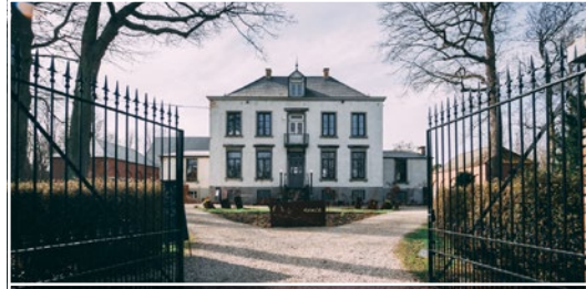
Le Domaine du Bocage 7041 Givry (B)