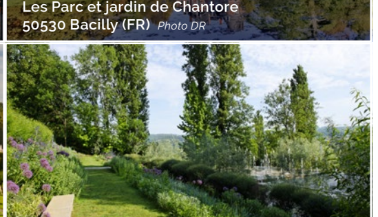
Les Jardins de l'Imaginaire 24120 Terrasson-Lavilledieu (FR)