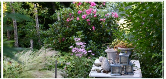
Le Jardin d'Arsac 19200 Saint-Fréjoux (FR)